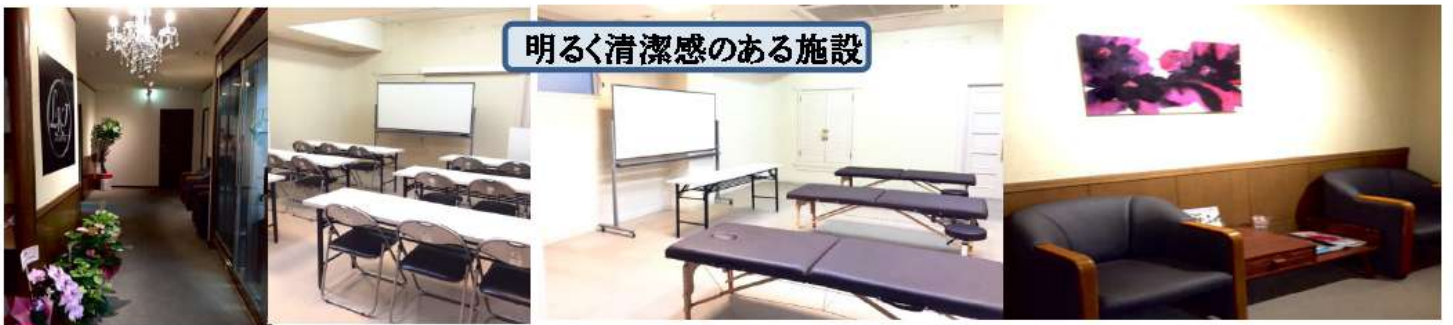
明るく清潔感のある施設

訓練時間総合計 学科 72時間 実技 162時間 職場見学 3時間 職業人講話 3時間 240時間